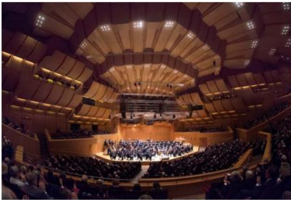
Deutsch perfekt 02/18