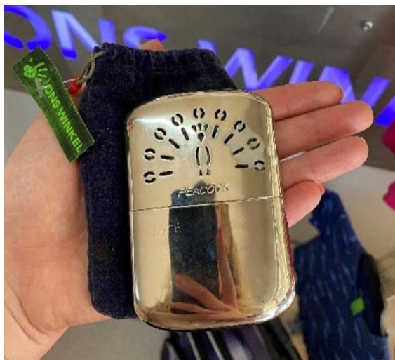
Handverwarmer uit 1950.