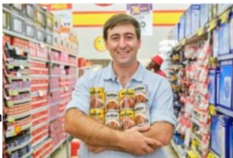
Danksy Eiren Drake is die gewilde Suid-Afrikaanse gereg nou in blikkies beskikbaar.