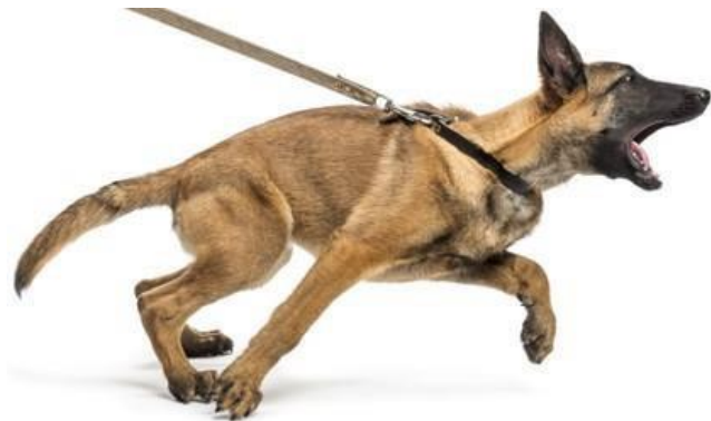
Ein Hund an der Leine