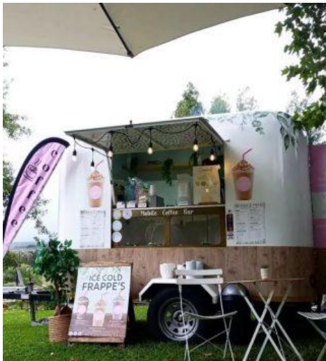
Lara's Coffee Bar, haar mobiele koffiewinkel